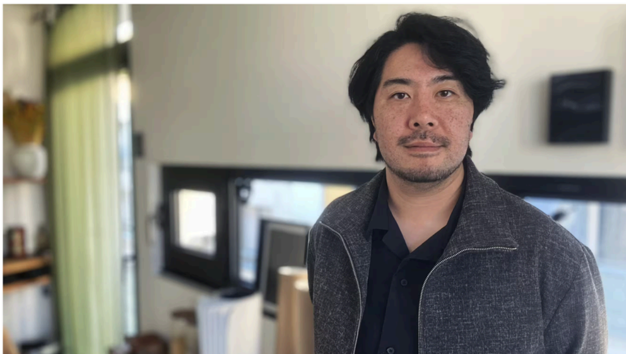
Le réalisateur japonais Akio Fujimoto, le 18 mars 2026 à Paris.

Laurence Houot - propos recueillis par France Télévisions - Rédaction Culture