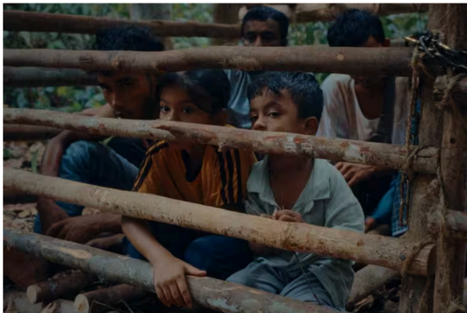
"Les Fleurs du manguiier", de Akio Fujimoto, sortie le 22 avril 2026.